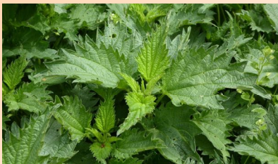
Brennnesselhaare enthalten Histamin

Das im Körper vorhandene Histamin wird abgebaut durch die Enzyme DAO – DiAminoOxidase im Darm wirksam und HNMT - Histamin-N-Methyltransferase im Bindegewebe wirksam.